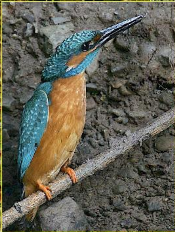
Abb. l. M.: Weil der Altvogel in der Nistkammer nicht wenden kann, kommt er im Rückwärtsgang aus der Röhre. Abb. l. u.: Der Eisvogel sieht einen kreisenden Bussard und macht sich schlank. Abb. r. u.: Ein Eisvogel mit einer zur Fütterung bestimmten Groppe.